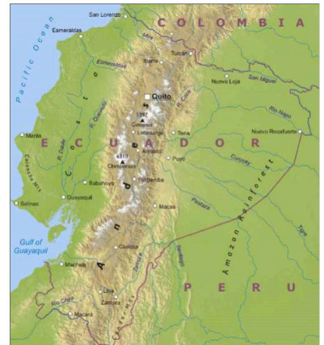
Carta fisica 2

L'Ecuador è attraversato dal Nord a Sud dalla catena delle Ande. e comprende tre regioni ben distinte per condizioni morfologiche oltre che ambientali: a ovest, affacciata all'Oceano Pacifico, è la Costa , al centro la Sierra , a est, verso il bacino amazzonico, l' Oriente .